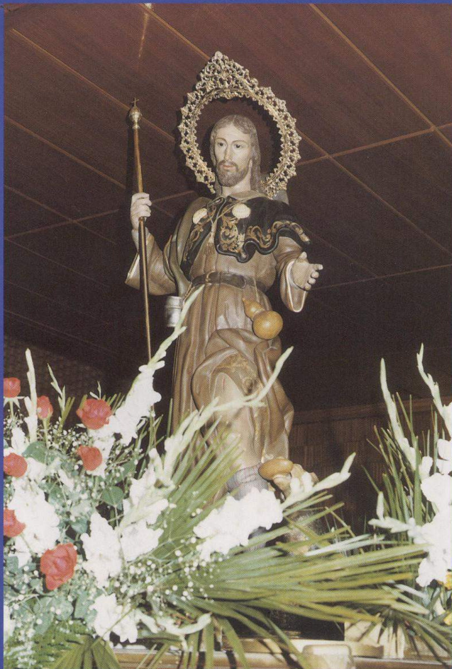
SAN ROQUE Patrón de Tobarra